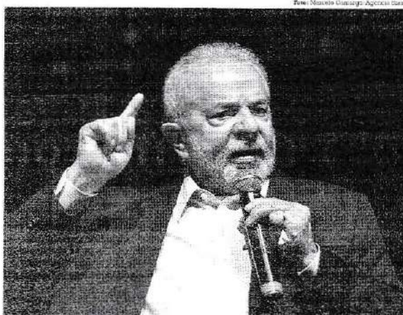
Professores da Universidade Federal da Paraíba acreditam que o ditloho será marca de Lula

No entanto, o favorecimento da esquerda na hora de escolher os ministros, pode dificultar essas negociações. "Eu acho que as escolhas vão ao encontro da expectativa do eleitorado que depositou os votos em Lula, mas haverá dificuldades nessa decisão de privilegiar pessoas do PT. Ou seja, partidos que precisam compor a partir do ano que vem, e que não estão no espectro, terão que dividir responsabilidades e poder com o novo governo, terá que abrir mão de cargos e recursos vinculados a outras instituições de estados".